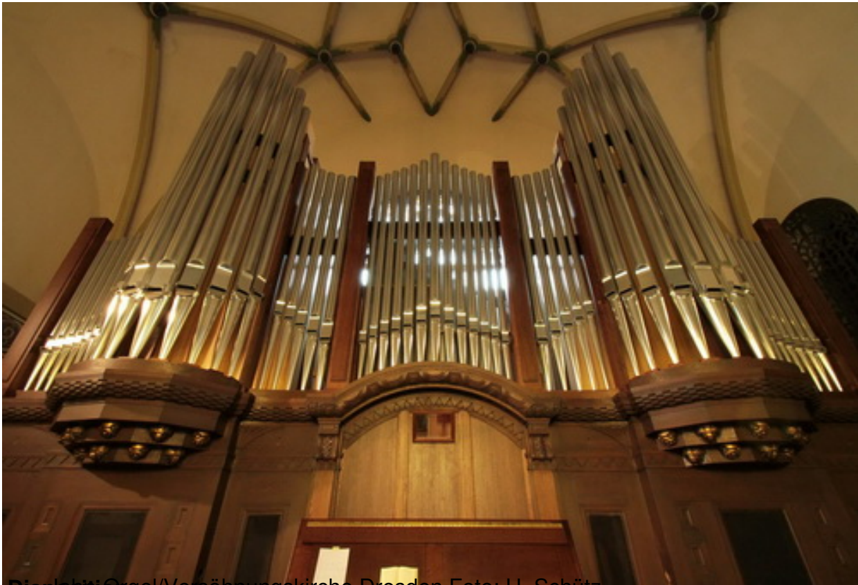
Disposition Orgel/Versöhnungskirche Dresden

I. Manual C – a ''' II. Manual C – a ''' III. Manual C – a '''